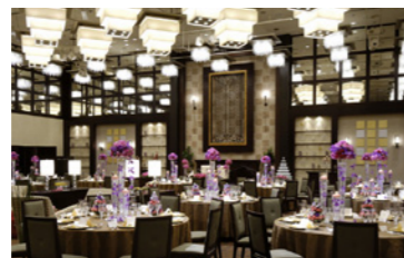
メルパルク OKAYAMA (P45 参照)