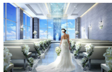
THE STYLE (P14・50 参照)