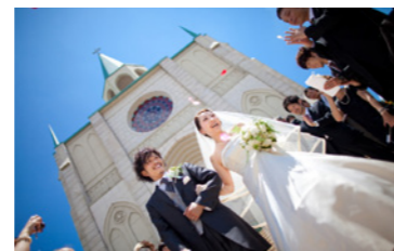
岡山国際ホテル (P43 参照)