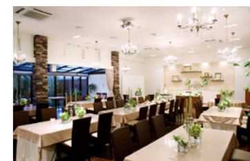
Le Merci (P6・7 参照)