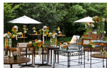
am boel (P8・9 参照)